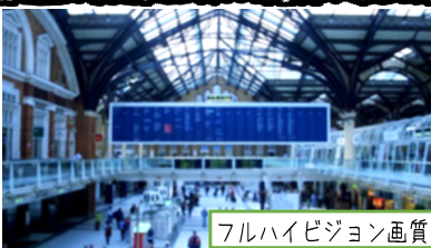
フルハイビジョン画質

今よりも4倍キレイな映像で臨場感を味わえる4Kテレビの新製品が5/22に発売。CX80のシリーズがおすすめで、現行のフルハイビジョン放送も4K