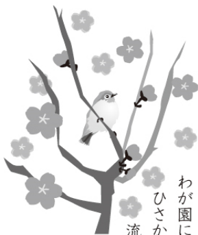
わが園に梅の花散る ひさかたの天より雪の 流れ来るかも 万葉集 大伴旅人 (おぼとものたびと)

各地で開催される梅まつりや盆梅展に出かけて、美しい春を先取りしましょう。なかでも、滋賀県長浜市で毎年開催される盆梅展は、滋賀県湖北地方の春の風物詩のひとつともなっています。「慶雲館」を会場とし、梅の盆栽を大広間に展示、開花時期に合わせて入替を行っているため、常に見頃の盆梅が楽しめます。