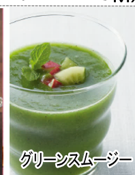
グリーンスムージー