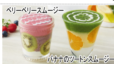
パナナのツートンスムージー