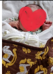
すでに小学2年生の甥っ子

と5歳の姪っ子がいますが、大好きすぎて甘やかしまくっています。2人とも、この間産まれたかと思いましたが、月日が経つのは早い。私は何も変わってませんが、どんどん大きくなっています。