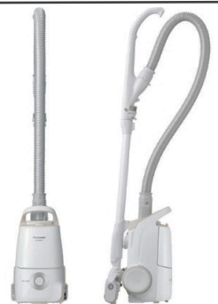
“パナソニックの店”限定モデル 品番MC-SJP830K

本体質量2kg、ホース・ハンドル部分も軽いので高い所もラクに掃除できる掃除機が、さらに進化して新登場！