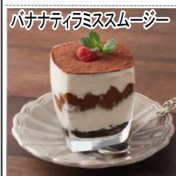
パナティイミスムージー